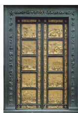
La PORTA del Battistero di Firenze

L'opera, prima di essere rappresentata in teatro, venne pubblicata come doppio long playing nel 1970. Gli interpreti principali del disco furono Ian Gillan nel ruolo di Gesù, Murray Head nel ruolo di Giuda e Yvonne Elliman nel ruolo di Maria Maddalena, ruolo che sostenne anche nella trasposizione cinematografica del 1973.